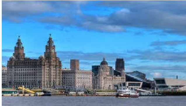
▲PierHead Waterfront_Liverpool

な建物が多く存在します。ヴィクトリア女王の時代に建てられた港周辺の赤レンガ倉庫（横浜の赤レンガ倉庫と似ていますが、数キロにわたる数倍規模のもので、今なお、住宅、オフィス、レストランなどに広く利用されています。また、大聖堂 2 軒、王立音楽会の音楽堂、ライバービルを初めとするウォーターフロントビルもきれいに保存され、何処にも負けないくらい立派な街づくりになっています。