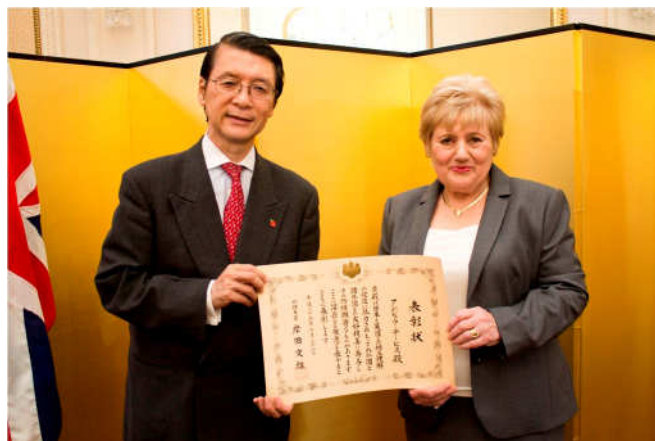
▲外務大臣表彰式、林駐英国特命全権大使と

昨年の 8 月、日本の外務大臣表彰をいただけることが発表されて、10 月に在英日本大使公邸で、表彰式が行われました。外務大臣表彰は、多くの方々が国際関係の様々な分野で活躍し、日本国と諸外国との友好親善関係の増進に多大なる貢献をしている中で、特に顕著な功績のあった個人および団体について、その功績を称えるとともに、その活動に対する一層の理解と支持を国民各層にお願いすることを目的としています。